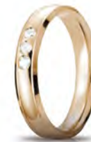
Oro giallo 40 AFC 279/003 col.01 ct. 0.09