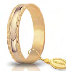
AF 235 col.03 Gr. 2,70