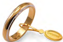
Classica bordi bianchi rodriati 50 AFN 1/01 col.37 Gr. 5,00