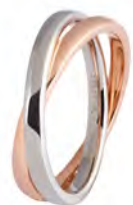
Oro bianco e rosa 24 AFC 11 col.35