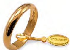
Classica oro giallo 30 AFN 1 col.01 Gr. 3,00