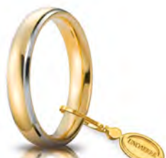
Comoda oro giallo bordi bianchi rodinati 4 mm 40 AFC 1/01 col.37 Gr. da 5,70 a 6,70