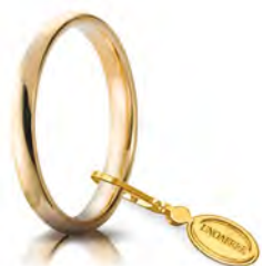
Comoda oro giallo 2,4 mm 24 AFC 1 col.01 Gr. da 2,50 a 3,50