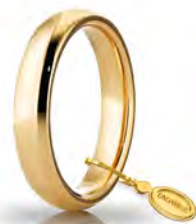
Comoda oro giallo 4 mm 40 AFC 1 col.01 Gr. da 5,85 a 6,85