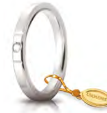
Oro bianco 2,5 mm 25 AFC 2/001 col.04 Gr. da 3,70 a 5,10 - ct. 0.03