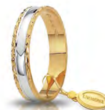
AF 235 col.36 Gr. 2,70