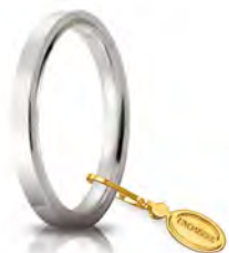
Oro bianco 2,5 mm 25 AFC 2 col.04 Gr. da 3,70 a 5,10