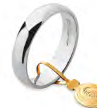
Larga oro bianco 40 AFN 6 col.04 Gr. 4,00