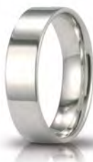
Oro bianco 5 mm 50 AFC 111 col.04 Gr. da 4,30 a 6,20