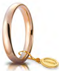
Comoda oro rosa 3,5 mm 35 AFC 1 col.18 Gr. da 4,95 a 5,65