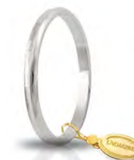
AF 271 col.04 Gr. 1,50