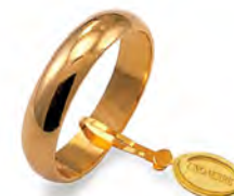
Larga oro giallo 50 AFN 6 col.01 Gr. 5,00