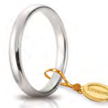
Comoda oro bianco 3 mm 30 AFC 1 col.04 Gr. da 3,85 a 4,80