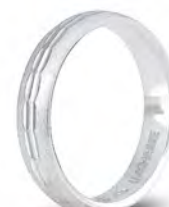
AF 288 col.04