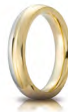
Eclissi oro bicolore 4 mm 70 AFC 283 col.07 Gr. da 6,70 a 7,20