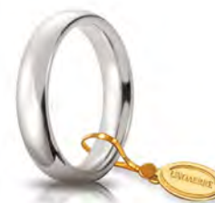
Comoda oro bianco 4 mm 40 AFC 1 col.04 Gr. da 5,85 a 6,85