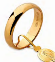
Larga oro giallo 40 AFN 6 col.01 Gr. 4,00