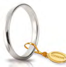
Comoda oro bianco 2,4 mm 24 AFC 1 col.04 Gr. da 2,50 a 3,50