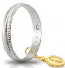
AF 236 col.04 Gr. 1,70