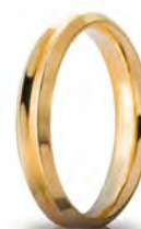
Oro giallo 40 AFC 278 col.01