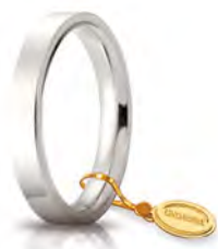
Oro bianco 3,5 mm 35 AFC 2 col.04 Gr. da 5,50 a 7,70