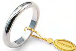
Francesina oro bianco 40 AFN 4 col.04 Gr. 4,00