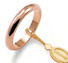
Francesina oro rosa 40 AFN 4 col.18 Gr. 4,00