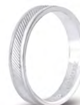
AF 289 col.04