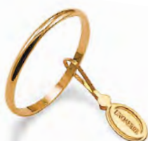
Francesina oro giallo 15 AFN 4 col.01 Gr. 1,50