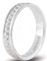
AF 285 col.04