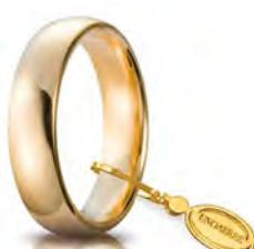
Comoda oro giallo 5 mm 50 AFC 1 col.01 Gr. da 7,00 a 8,70