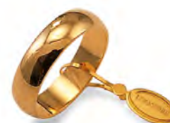
Mantovana oro giallo 50 AFN 7 col.01 Gr. 5,00