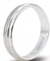
AF 287 col.04