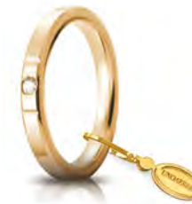
Oro giallo 2,5 mm 25 AFC 2/001 col.01 Gr. da 3,70 a 5,10 - ct. 0.03