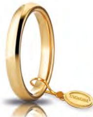
Comoda oro giallo 3,5 mm 35 AFC 1 col.01 Gr. da 4,95 a 5,65