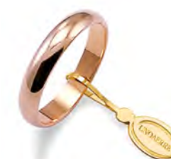
Classica oro rosa 50 AFN 1 col.18 Gr. 5,00

Il simbolo prezioso dell'unione, lo stesso che la rappresenta in una forma costante e perfetta: senza inizio a senza fine, per tutta la vita.