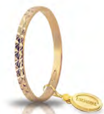
AF 269 col.03 Gr. 1,40