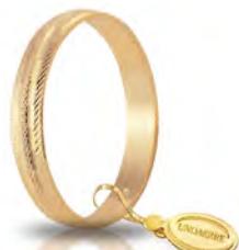
AF 236 col.03 Gr. 1,70