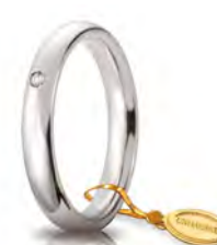
Comoda oro bianco 3,5 mm 35 AFC 1/001 col.04 Gr. da 4,95 a 5,65 - ct. 0.03