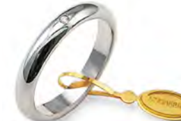
Classica oro bianco 50 AFN 1/001 col.04 Gr. 5,00 - ct. 0.03