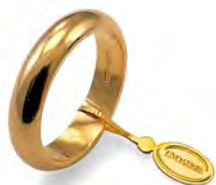
Classica oro giallo 100 AFN 1 col.01 Gr. 10,00