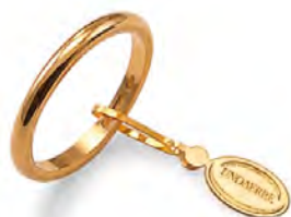
Francesina oro giallo 30 AFN 4 col.01 Gr. 3,00