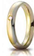
Eclissi oro bicolore 4 mm 70 AFC 283/001 col.07 Gr. da 6,70 a 7,20 - ct. 0.03