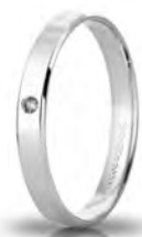
30 AC 287/001 col.04 Gr. 2,00 - ct. 0.01