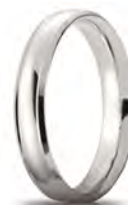
Oro bianco 40 AFC 279 col.04