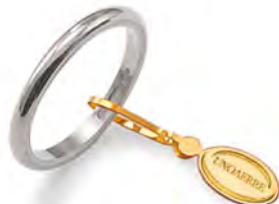
Francesina oro bianco 30 AFN 4 col.04 Gr. 3,00