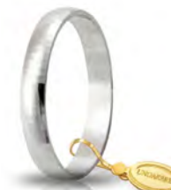
AF 246 col.04 Gr. 2,20