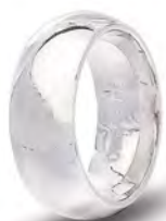
70 AFC 1 col.04 Rodiata lucida