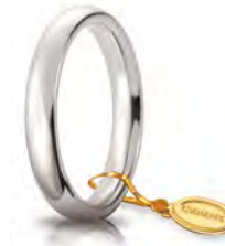
Comoda oro bianco 3,5 mm 35 AFC 1 col.04 Gr. da 4,95 a 5,65