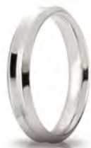
Oro bianco 40 AFC 278 col.04