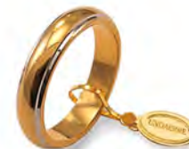
Classica bordi bianchi rodriati 70 AFN 1/01 col.37 Gr. 7,00