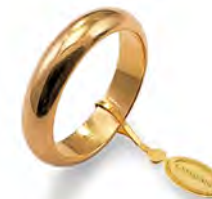
Classica oro giallo 80 AFN 1 col.01 Gr. 8,00