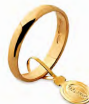
Larga oro giallo 20 AFN 6 col.01 Gr. 2,00