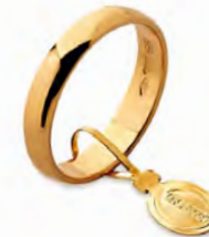
Larga oro giallo 30 AFN 6 col.01 Gr. 3,00