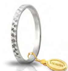
AF 269 col.04 Gr. 1,40