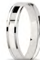
AF 305 col.04 "Fedina Comoda"