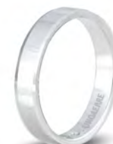
AF 290 col.04