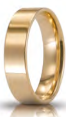
Oro giallo 5 mm 50 AFC 111 col.01 Gr. da 4,30 a 6,20