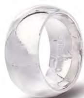
100 AFC 1 col.04 Rodiata lucida