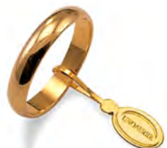
Classica oro giallo 50 AFN 1 col.01 Gr. 5,00