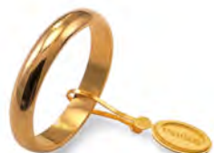
Classica oro giallo 40 AFN 1 col.01 Gr. 4,00