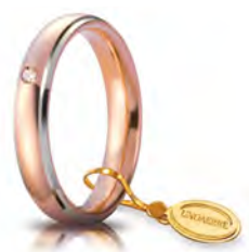
Comoda oro rosa bordi bianchi rodiali 4 mm 40 AFC 1/0113 col.35 Gr. da 5,70 a 6,70 - ct. 0.03