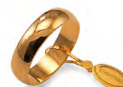
Mantovana oro giallo 60 AFN 7 col.01 Gr. 6,00