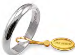
Classica oro bianco 30 AFN 1 col.04 Gr. 3,00