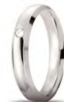
Oro bianco 40 AFC 279/001 col.04 ct. 0.03