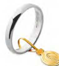
Larga oro bianco 20 AFN 6 col.04 Gr. 2,00