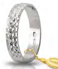
AF 161/3 col.04 Gr. 3,00