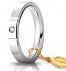
Oro bianco 3,5 mm 35 AFC 2/001 col.04 Gr. da 5,50 a 7,70 - ct. 0.05