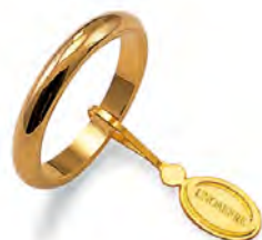
Francesina oro giallo 40 AFN 4 col.01 Gr. 4,00