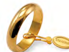
Classica oro giallo 70 AFN 1 col.01 Gr. 7,00