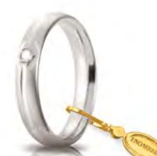
Comoda satinata oro bianco 40 AFC 1/011 col.04 Gr. da 5,85 a 6,85 - ct. 0.03

Un anello che unisce l'amore al comfort. UNOERRE ha creato "Comoda", la fede unica come il blocco di oro dal quale nasce senza saldature modellata da una punta di diamante. Un cerchio perfetto che non si interrompe mai.