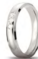
Oro bianco 40 AFC 279/003 col.04 ct. 0.09