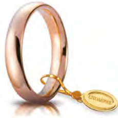
Comoda oro rosa 4 mm 40 AFC 1 col.18 Gr. da 5,85 a 6,85