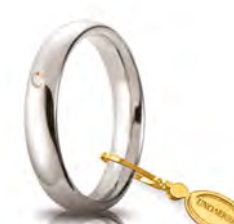
Comoda oro bianco 4 mm 40 AFC 1/001 col.04 Gr. da 5,85 a 6,85 - ct. 0.03