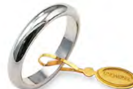
Classica oro bianco 50 AFN 1 col.04 Gr. 5,00