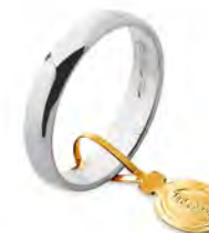
Larga oro bianco 30 AFN 6 col.04 Gr. 3,00