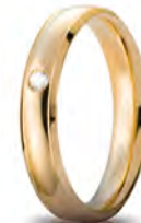
Oro giallo 40 AFC 279/001 col.01 ct. 0.03