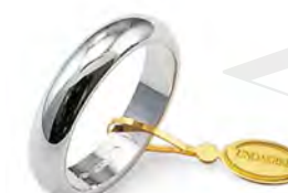
Classica oro bianco 70 AFN 1 col.04 Gr. 7,00