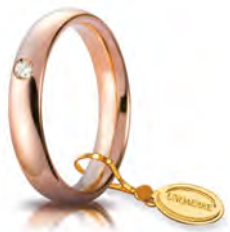
Comoda oro rosa 4 mm 40 AFC 1/0015 col.18 Gr. da 5,85 a 6,85 - ct. 0.05