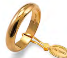
Classica oro giallo 60 AFN 1 col.01 Gr. 6,00