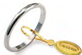
Francesina oro bianco 15 AFN 4 col.04 Gr. 1,50