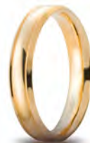
Oro giallo 40 AFC 279 col.01