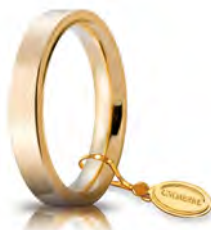
Oro giallo 3,5 mm 35 AFC 2 col.01 Gr. da 5,50 a 7,70