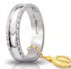
AF 235 col.04 Gr. 2,70