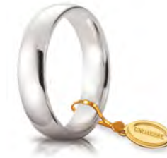
Comoda oro bianco 5 mm 50 AFC 1 col.04 Gr. da 7,00 a 8,70