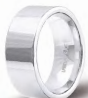
70 AFC 2 col.04 Rodiata lucida