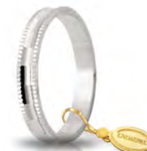
AF 240 col.04 Gr. 1,90