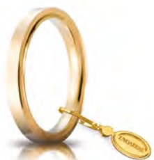
Oro giallo 2,5 mm 25 AFC 2 col.01 Gr. da 3,70 a 5,10