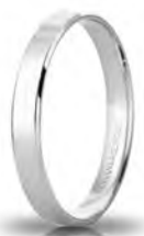
30 AC 287 col.04 Gr. 2,00