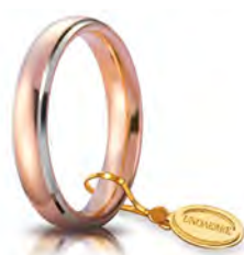
Comoda oro rosa bordi bianchi rodiali 4 mm 40 AFC 1/01 col.35 Gr. da 5,70 a 6,70