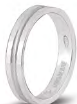
AF 286 col.04