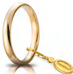
Comoda oro giallo 3 mm 30 AFC 1 col.01 Gr. da 3,85 a 4,80