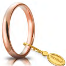
Comoda oro rosa 3 mm 30 AFC 1 col.18 Gr. da 3,85 a 4,80