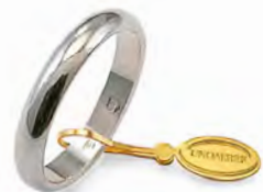
Classica oro bianco 40 AFN 1 col.04 Gr. 4,00