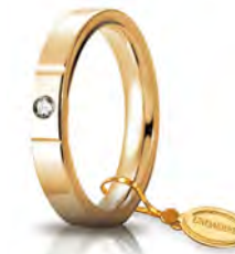
Oro giallo 3,5 mm 35 AFC 2/001 col.01 Gr. da 5,50 a 7,70 - ct. 0.05