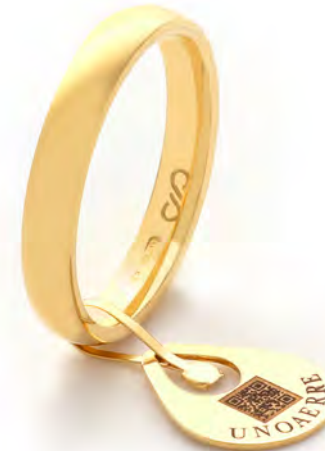
Anello Blockchain Comodo 50 ABC1 col.01 Gr. da 4,95 a 5,65

( Il peso si riferisce all'anello sprovisto di sigillo )