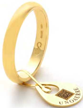
Anello Blockchain Classico 50 ABN1 col.01 Gr. 5,00

( Il peso si riferisce all'anello sprovisto di sigillo )