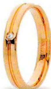
Oro rosa ct. 0.02