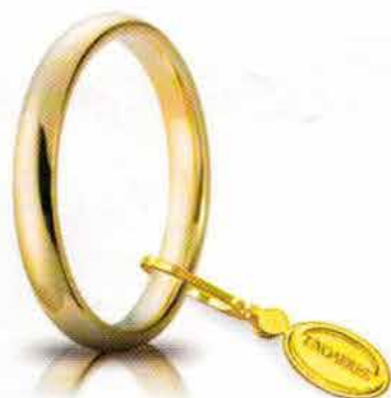
Comoda oro giallo 3 mm