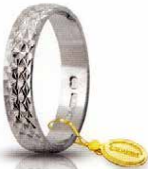
AF 161/3 col.04 Gr. 3,0