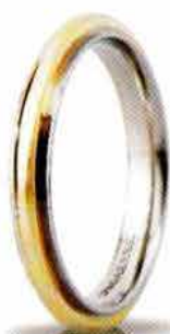
"Slim" oro bicolore