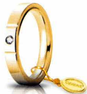
Oro giallo 3,5 mm ct. 0.05