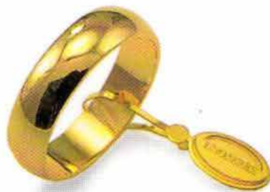
Mantovana oro giallo Gr. 6,0