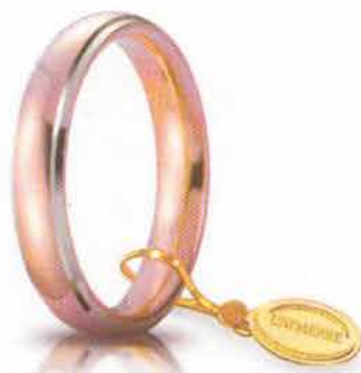
Comoda oro rosa bordi bianchi rodiati 4 mm