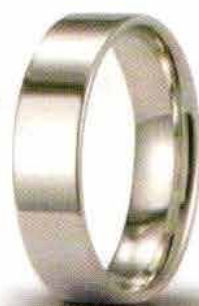
Oro bianco 5 mm