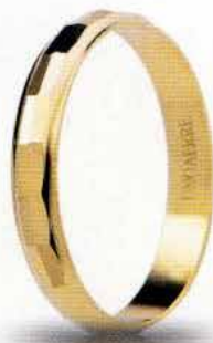
AF 296 col.03 Gr. 1,6