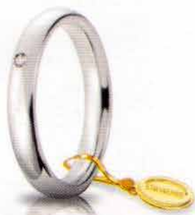
Comoda oro bianco 3,5 mm ct. 0.03