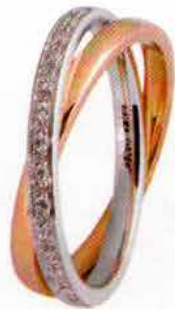
Oro bianco e rosa ct. 0.30