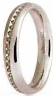
Oro bianco ct. 0.15