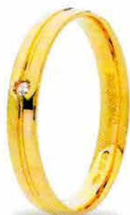
Oro giallo ct. 0.02