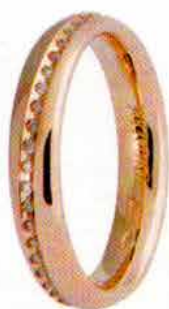
Oro rosa ct. 0.15