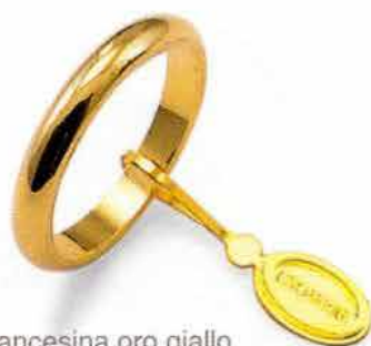
Francesina oro giallo Gr. 4,0