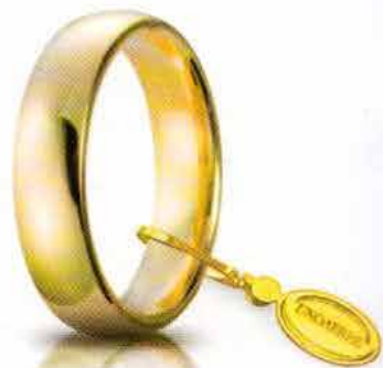
Comoda oro giallo 5 mm

Un anello che unisce l'amore al comfort. UNOAERRE ha creato "Comoda", la fede unica come il blocco di oro dal quale nasce senza saldature modellata da una punta di diamante. Un cerchio perfetto che non si interrompe mai.