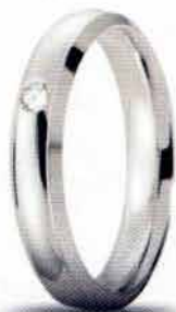
Oro Bianco ct. 0.03