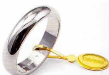
Classica oro bianco Gr. 7,0