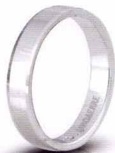
AF 290 col.04