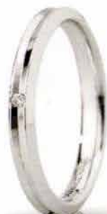
"Slim" oro bianco ct. 0.01