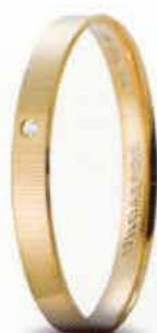
30 AC 287/001 col.03 Gr. 2,0 - ct. 0.01