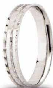
AF 308 col.04 "Fedina Comoda"