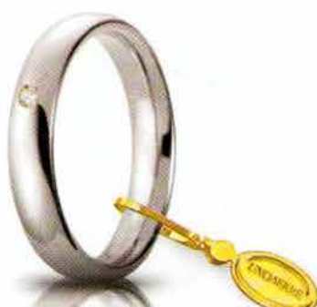
Comoda oro bianco 4 mm ct. 0.03