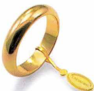
Classica oro giallo Gr. 8,0