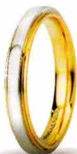
"Slim" oro bicolore