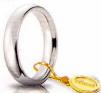
Comoda oro bianco 4 mm