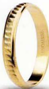
AF 295 col.03 Gr. 1,7