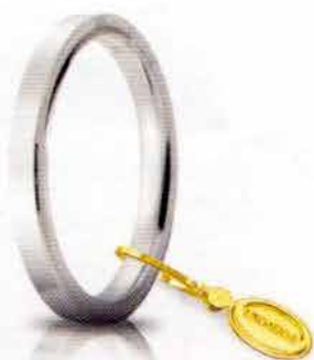
Oro bianco 2,5 mm