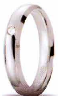
Oro bianco ct. 0.03