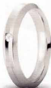
Oro bianco ct. 0.02