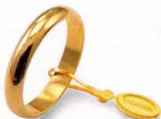
Classica oro giallo Gr. 4,0