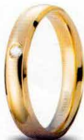
Oro giallo ct. 0.03