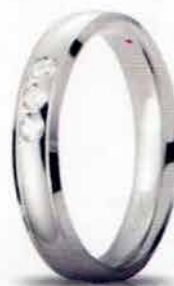
Oro bianco ct. 0.09