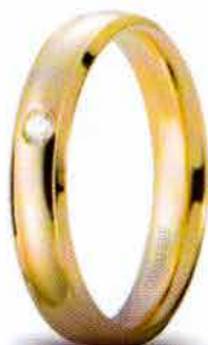
Oro giallo ct. 0.03