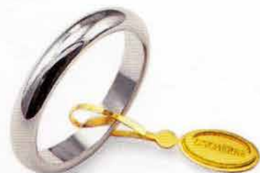
Classica oro bianco Gr. 5,0