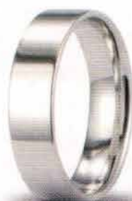
Oro bianco 5 mm