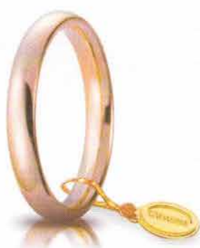
Comoda oro rosa 3,5 mm