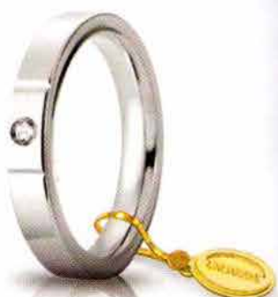
Oro bianco 3,5 mm ct. 0.05

La linea Cerchi di Luce è una elegante interpretazione delle fedi comode UNOAERRE, impreziosite dalla luminosità dei diamanti e dalla ricercatezza del design.