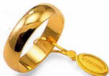
Mantovana oro giallo Gr. 5,0