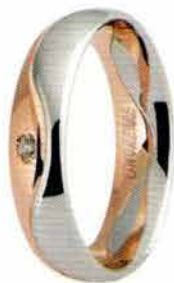
Oro bianco e rosa ct. 0.02