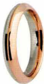
Oro bianco e rosa