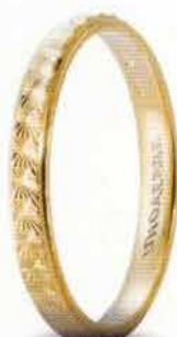
30 AC 288 col.03 Gr. 2,0