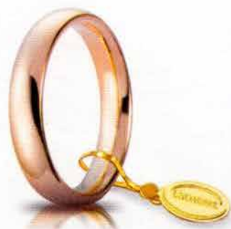
Comoda oro rosa 4 mm