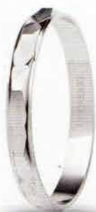
AF 293 col.04 Gr. 1,5