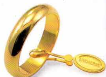
Classica oro giallo Gr. 7,0