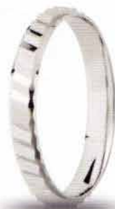
AF 307 col.04 "Fedina Comoda"