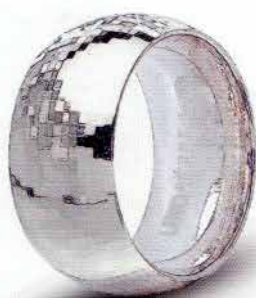
100 AFC 1/02 col.04 Rodiata diamantata