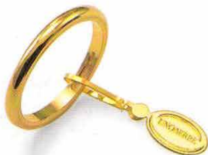
Francestina oro giallo Gr. 3,0