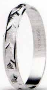
AF 298 col.04 Gr. 1,6