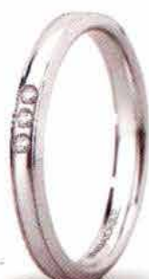
"Slim" oro bianco ct. 0.03