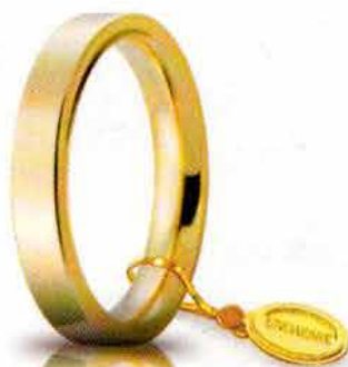
Oro giallo 3,5 mm