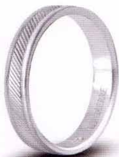
AF 289 col.04