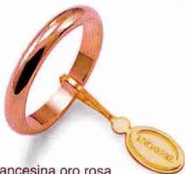
Francestina oro rosa Gr. 4,0