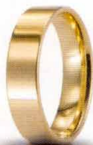
Oro giallo 5 mm