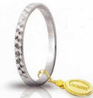
AF 269 col.04 Gr. 1,4