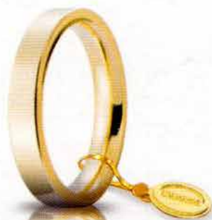
Oro giallo 3,5 mm