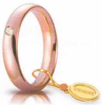
Comoda oro rosa 4 mm ct. 0.05