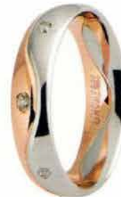
Oro bianco e rosa ct. 0.08