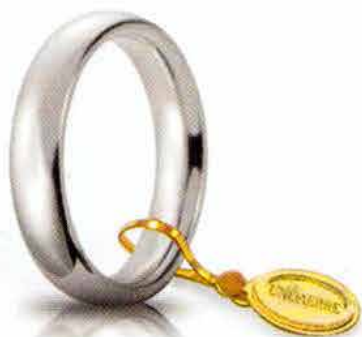
Comoda oro bianco 4 mm