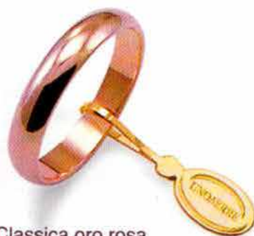
Classica oro rosa Gr. 5,0

Il simbolo prezioso dell'unione, lo stesso che la rappresenta in una forma costante e perfetta: senza inizio e senza fine, per tutta la vita.