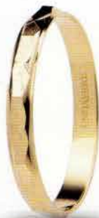
AF 293 col.03 Gr. 1,5