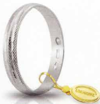
AF 236 col.04 Gr. 1,7