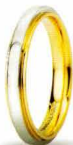
"Slim" oro bicolore