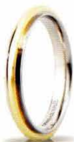
"Slim" oro bicolore