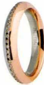
Oro bianco e rosa ct. 0.17