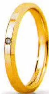
"Slim" oro giallo ct. 0.01