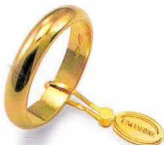
Classica oro giallo Gr. 6,0