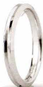
"Slim" oro bianco