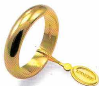
Classica oro giallo Gr. 10,0