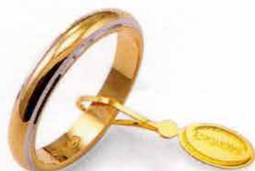
Classica bordi bianchi rodiati Gr. 5,0