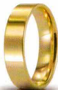
Oro giallo 5 mm