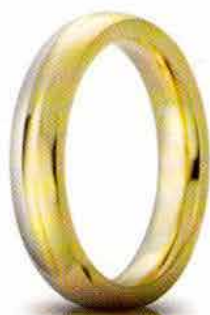
Eclissi oro bicolore 4 mm