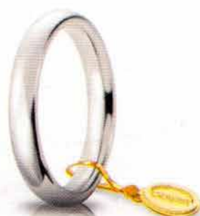
Comoda oro bianco 3,5 mm