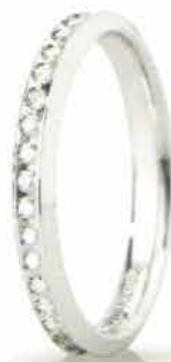
"Slim" oro bianco ct. 0.34