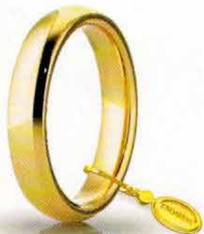
Comoda oro giallo 4 mm