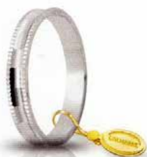
AF 240 col.04 Gr. 1,9