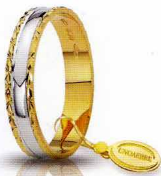
AF 235 col.36 Gr. 2,7