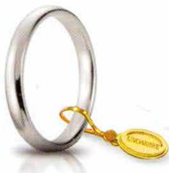
Comoda oro bianco 3 mm