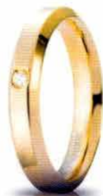
Oro giallo ct. 0.03