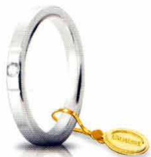
Oro bianco 2,5 mm ct. 0.03