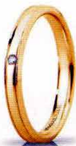
"Slim" oro giallo ct. 0.01