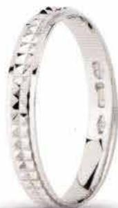
AF 306 col.04 "Fedina Comoda"