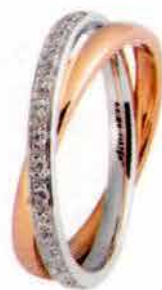
Oro bianco e rosa ct. 0.30