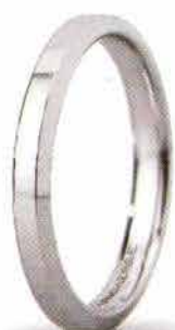
"Slim" oro bianco