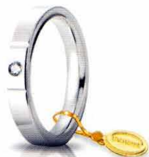
Oro bianco 3,5 mm ct. 0.05

La linea Cerchi di Luce è una elegante interpretazione delle fedie comode UNOAERRE, impreziosite dalla luminosità dei diamanti e dalla ricercatezza del design. Tutte le fedie Cerchi di Luce sono arricchite da un raffinato sigillo UNOAERRE in oro giallo.