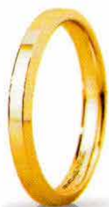
"Slim" oro giallo