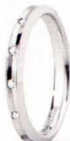
"Slim" oro bianco ct. 0.08