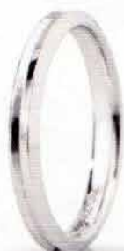
"Slim" oro bianco