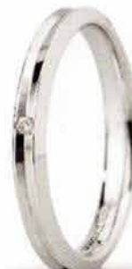
"Slim" oro bianco ct. 0.01