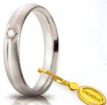
Comoda satinata oro bianco ct. 0.03

In tutti i modelli, lo spessore e la larghezza degli anelli rimangono costanti indipendentemente dalla misura sia per lui che per lei. Tutte le fedi Comode sono arricchite da un raffinato sigillo UNOAERRE in oro giallo.