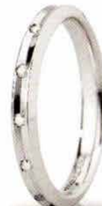
"Slim" oro bianco ct. 0.08