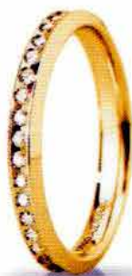
"Slim" oro giallo ct. 0.34