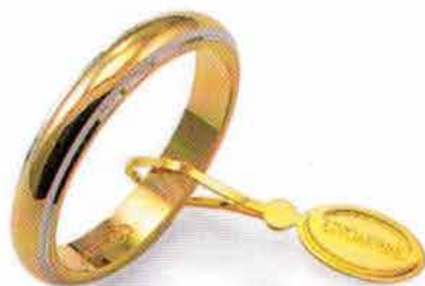
Classica bordi bianchi rodiali Gr. 5,0