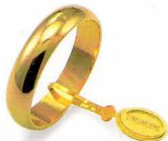
Larga oro giallo Gr. 5,0