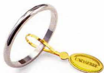
Francestina oro bianco Gr. 1,5