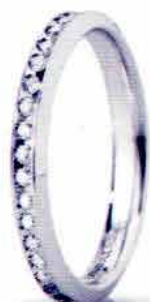
"Slim" oro bianco ct. 0.34