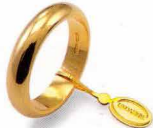
Classica oro giallo Gr. 10,0