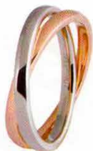
Oro bianco e rosa