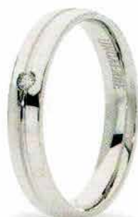
Oro bianco ct. 0.02