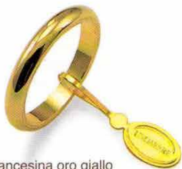
Francestina oro giallo Gr. 4,0