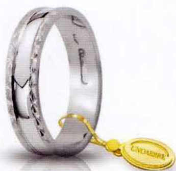
AF 235 col.04 Gr. 2,7