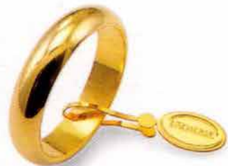
Classica oro giallo Gr. 7,0