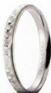
30 AC 288 col.04 Gr. 2,0