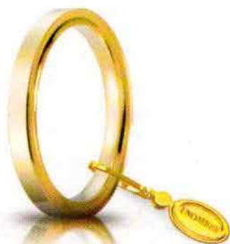
Oro giallo 2,5 mm