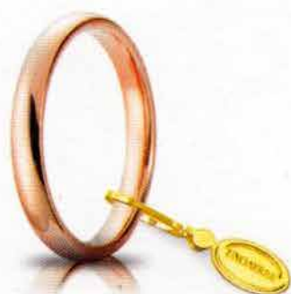
Comoda oro rosa 3 mm