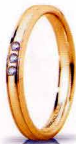
"Slim" oro giallo ct. 0.03