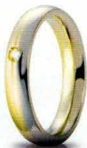
Eclissi oro bicolore 4 mm ct. 0.03