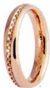
Oro rosa ct. 0.15