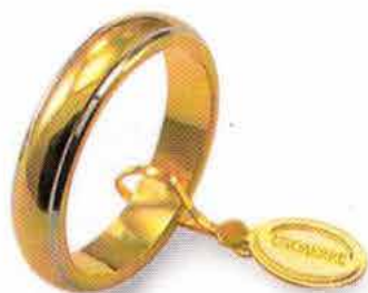
Classica bordi bianchi rodiali Gr. 7,0