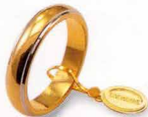
Classica bordi bianchi rodiati Gr. 7,0