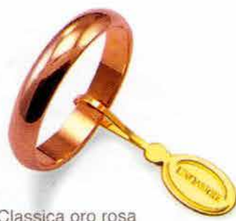
Classica oro rosa Gr. 5,0

Il simbolo prezioso dell'unione, lo stesso che la rappresenta in una forma costante e perfetta: senza inizio e senza fine, per tutta la vita.