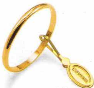
Francestina oro giallo Gr. 1,5