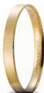
30 AC 287 col.03 Gr. 2,0