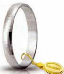
AF 246 col.04 Gr. 2,2