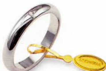
Classica oro bianco Gr. 5,0 ct. 0.03