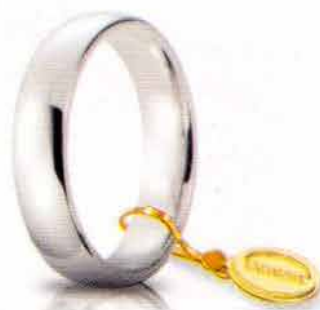
Comoda oro bianco 5 mm