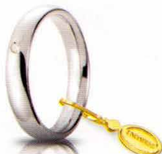
Comoda oro bianco 4 mm ct. 0.03