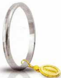
AF 271 col.04 Gr. 1,5