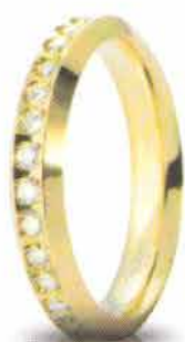
Oro giallo ct. 0.60