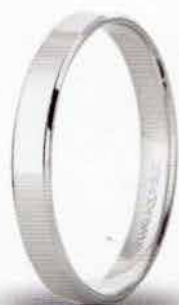
30 AC 287 col.04 Gr. 2,0