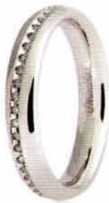
Oro bianco ct. 0.15