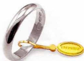
Classica oro bianco Gr. 3,0