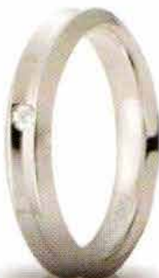
Oro bianco ct. 0.02