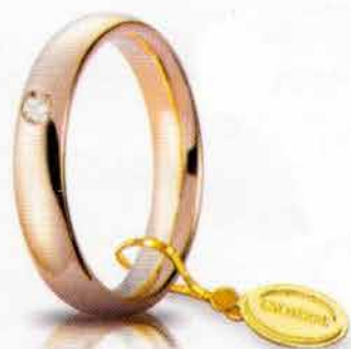
Comoda oro rosa 4 mm ct. 0.05