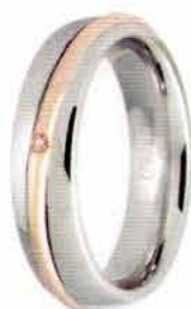
Oro bianco e rosa ct. 0.01