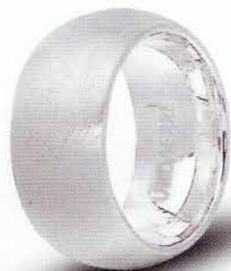
100 AFC 1/01 col.04 Rodiata satinata