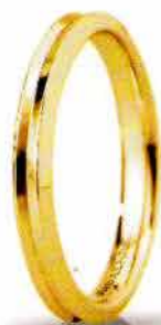
"Slim" oro giallo