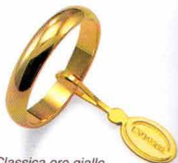
Classica oro giallo Gr. 5,0