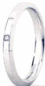
"Slim" oro bianco ct. 0.01