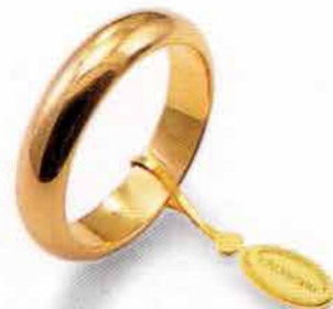
Classica oro giallo Gr. 8,0