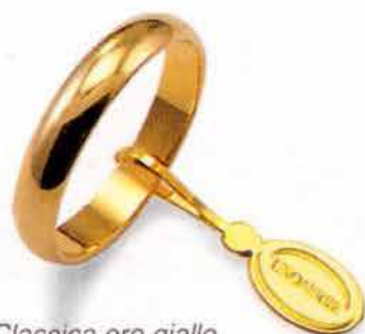
Classica oro giallo Gr. 5,0