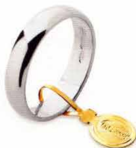
Larga oro bianco Gr. 4,0