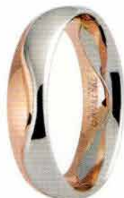
Oro bianco e rosa