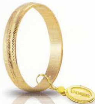
AF 236 col.03 Gr. 1,7