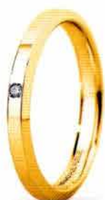
"Slim" oro giallo ct. 0.01