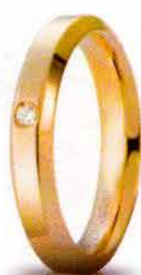
Oro giallo ct. 0.03