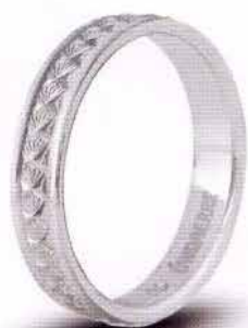
AF 285 col.04