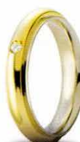
Oro bicolore ct. 0.03

Brillanti Promesse, la nuova collezione di fedi con diamante, è stata realizzata per soddisfare il desiderio di fedi sempre più preziose riaffermando il primato che UNOAERRE da sempre detiene.