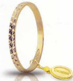
AF 269 col.03 Gr. 1,4