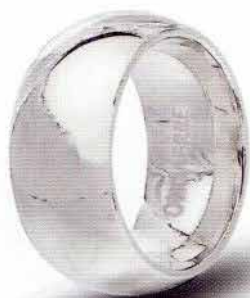
100 AFC 1 col.04 Rodiata lucida