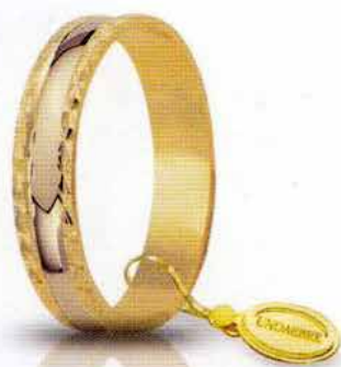
AF 235 col.03 Gr. 2,7