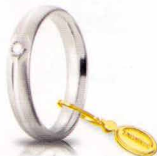
Comoda satinata oro bianco ct. 0.03

In tutti i modelli, lo spessore e la larghezza degli anelli rimangono costanti indipendentemente dalla misura sia per lui che per lei. Tutte le fedi Comode sono arricchite da un raffinato sigillo UNOAERRE in oro giallo.