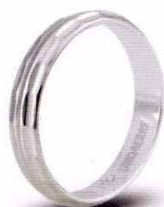
AF 287 col.04