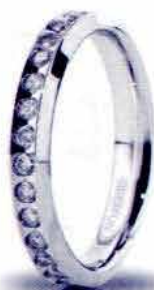
Classica oro bianco ct. 0.60