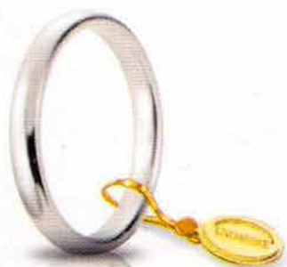
Comoda oro bianco 3 mm