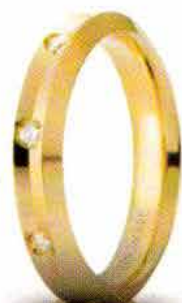
Oro giallo ct. 0.16