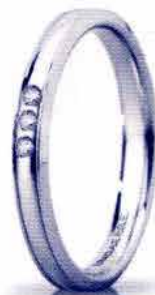
"Slim" oro bianco ct. 0.03