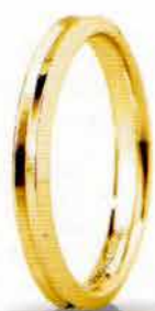
"Slim" oro giallo