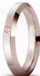
Oro bianco ct. 0.03