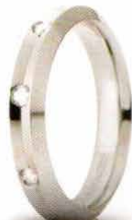
Oro bianco ct. 0.16