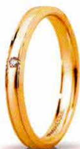
"Slim" oro giallo ct. 0.01