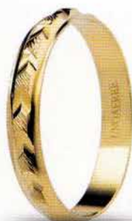
AF 298 col.03 Gr. 1,6

Tutti i pesi indicati sono soggetti alla tolleranza di +/- 5%