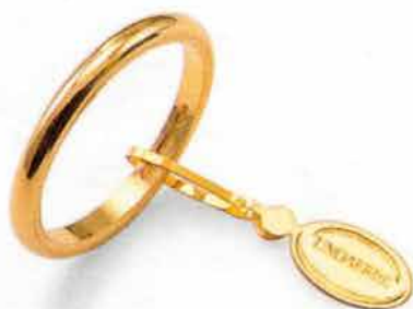
Francesina oro giallo Gr. 3,0