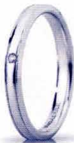
"Slim" oro bianco ct. 0.01