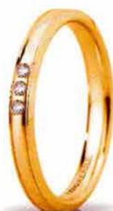
"Slim" oro giallo ct. 0.03