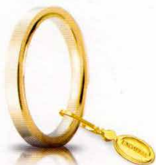
Oro giallo 2,5 mm