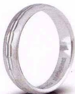
AF 288 col.04