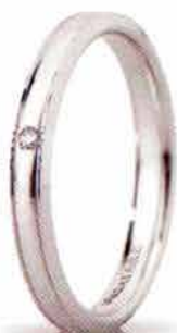
"Slim" oro bianco ct. 0.01