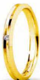
"Slim" oro giallo ct. 0.01