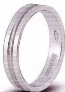
AF 286 col.04