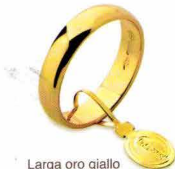
Larga oro giallo Gr. 4,0