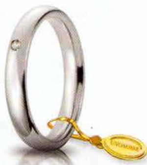
Comoda oro bianco 3,5 mm ct. 0.03