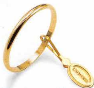
Francesina oro giallo Gr. 1,5