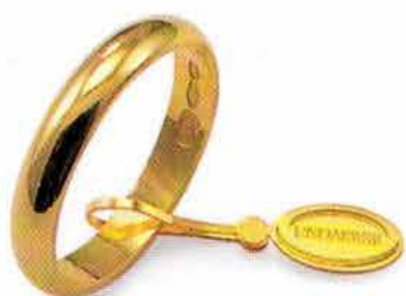
Classica oro giallo Gr. 3,0