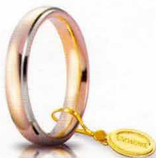
Comoda oro rosa bordi bianchi rodiati 4 mm