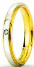
"Slim" oro bicolore ct. 0.01