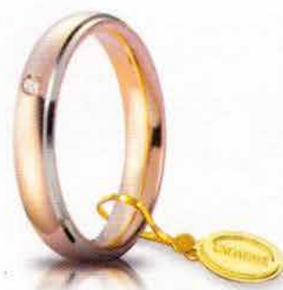
Comoda oro rosa bordi bianchi rodiati 4 mm ct. 0.03