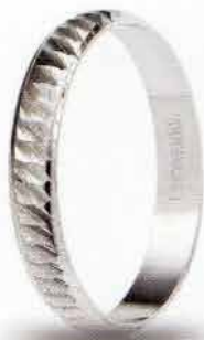
AF 295 col.04 Gr. 1,7