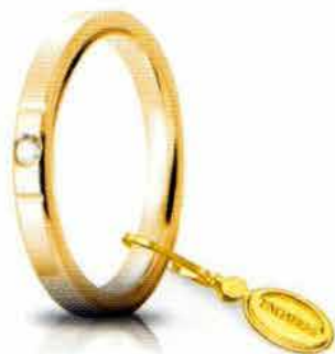
Oro giallo 2,5 mm ct. 0.03