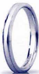
"Slim" oro bianco