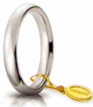
Comoda oro bianco 3,5 mm