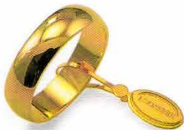
Mantovana oro giallo Gr. 5,0