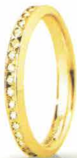
"Slim" oro giallo ct. 0.34