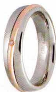
Oro bianco e rosa ct. 0.01