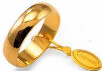
Mantovana oro giallo Gr. 6,0