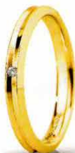
"Slim" oro giallo ct. 0.01