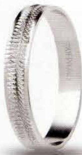
AF 294 col.04 Gr. 1,7