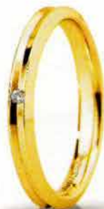
"Slim" oro giallo ct. 0.01