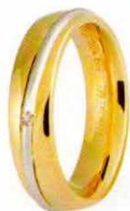
Oro giallo e bianco ct. 0.01