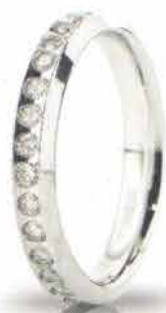
Oro bianco ct. 0.60