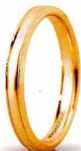
"Slim" oro giallo