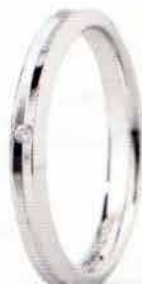
"Slim" oro bianco ct. 0.01