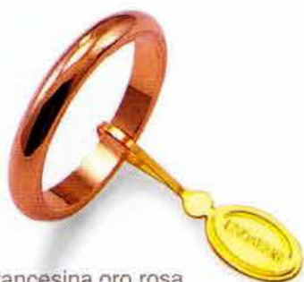
Francesina oro rosa Gr. 4,0