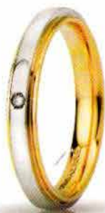
"Slim" oro bicolore ct. 0.01