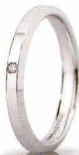
"Slim" oro bianco ct. 0.01