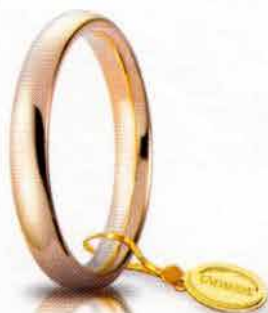
Comoda oro rosa 3,5 mm