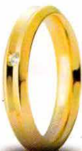
Oro giallo ct. 0.02