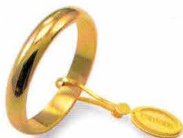
Classica oro giallo Gr. 4,0