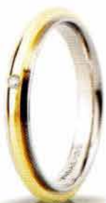
"Slim" oro bicolore ct. 0.01