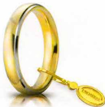
Comoda oro giallo bordi bianchi rodiati 4 mm