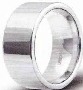
100 AFC 2 col.04 Rodiata lucida