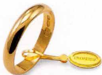
Classica oro giallo Gr. 3,0