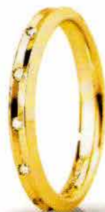
"Slim" oro giallo ct. 0.08