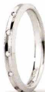
"Slim" oro bianco ct. 0.08