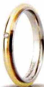
"Slim" oro bicolore ct. 0.01