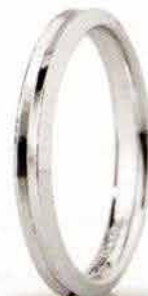
"Slim" oro bianco