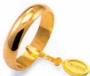
Larga oro giallo Gr. 5,0