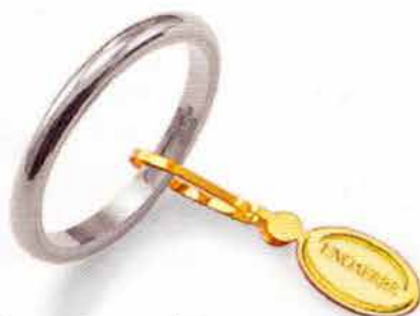
Francestina oro bianco Gr. 3,0