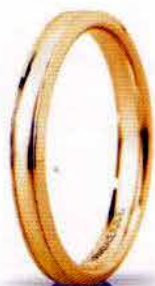
"Slim" oro giallo