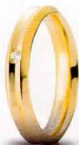
Oro giallo ct. 0.02