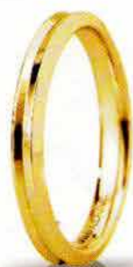
"Slim" oro giallo