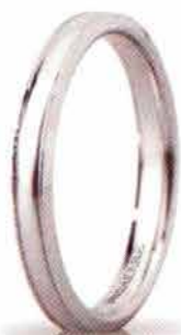
"Slim" oro bianco