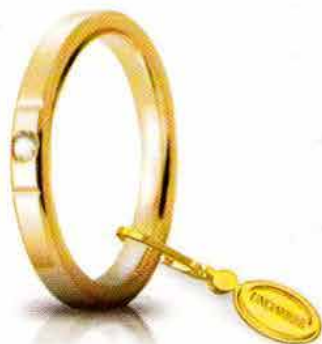
Oro giallo 2,5 mm ct. 0.03