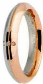
Oro bianco e rosa ct. 0.01