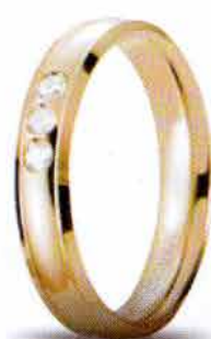
Oro giallo ct. 0.09