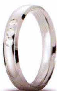
Oro bianco ct. 0.09