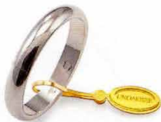
Classica oro bianco Gr. 4,0