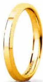
"Slim" oro giallo