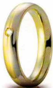
Eclissi oro bicolore 4 mm ct. 0.03