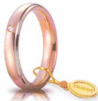
Comoda oro rosa bordi bianchi rodiati 4 mm ct. 0.03