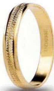
AF 294 col.03 Gr. 1,7