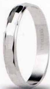
AF 296 col.04 Gr. 1,6