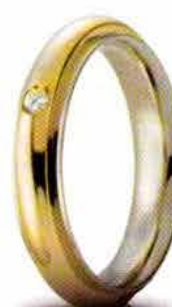
Oro bicolore ct. 0.03

Brillanti Promesse, la collezione di fedi con diamante realizzata per soddisfare il desiderio di fedi sempre più preziose riaffermando il primato che UNOAERRE da sempre detiene.