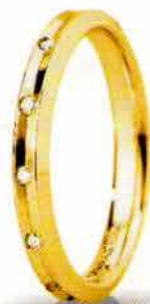
"Slim" oro giallo ct. 0.08