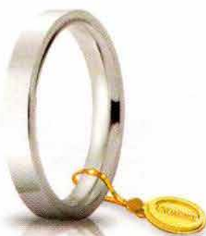
Oro bianco 3,5 mm