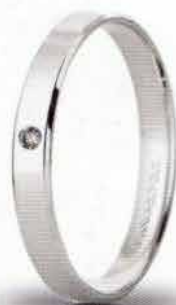
30 AC 287/001 col.04 Gr. 2,0 - ct. 0.01