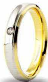
Oro bicolore ct. 0.03

Non solo per matrimoni ma per qualsiasi ricorrenza che possa segnare i momenti importanti di una storia legata all'amore. Le fedi Brillanti Promesse sono firmate UNOAERRE all'interno di ogni anello.