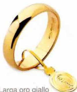
Larga oro giallo Gr. 4,0