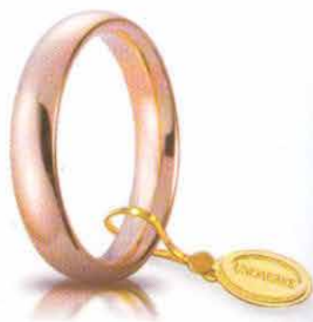
Comoda oro rosa 4 mm