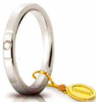
Oro bianco 2,5 mm ct. 0.03