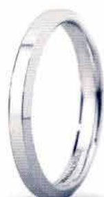
"Slim" oro bianco