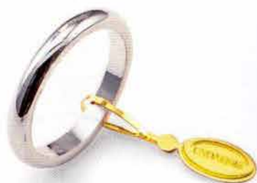
Francestina oro bianco Gr. 4,0