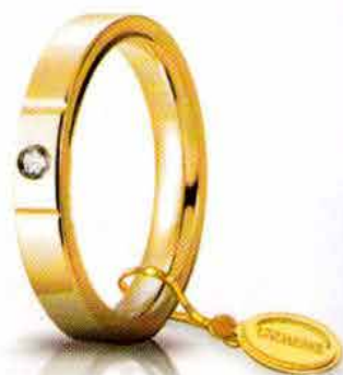
Oro giallo 3,5 mm ct. 0.05