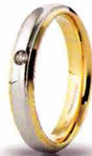
Oro bicolore ct. 0.03

Non solo per matrimoni ma per qualsiasi ricorrenza che possa segnare i momenti importanti di una storia legata all'amore. Le fedi Brillanti Promesse sono firmate UNOAERRE all'interno di ogni anello.