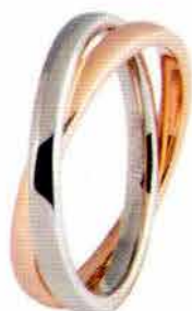
Oro bianco e rosa