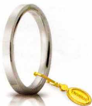
Oro bianco 2,5 mm