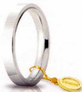
Oro bianco 3,5 mm