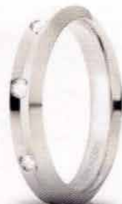
Oro bianco ct. 0.16