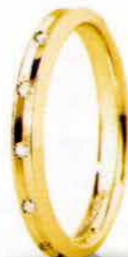
"Slim" oro giallo ct. 0.08