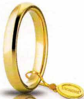
Comoda oro giallo 3,5 mm