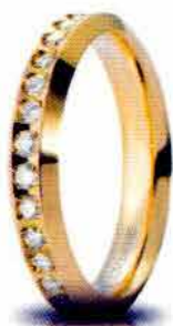
Classica oro giallo ct. 0.60