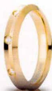
Oro giallo ct. 0.16