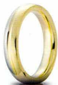
Eclissi oro bicolore 4 mm