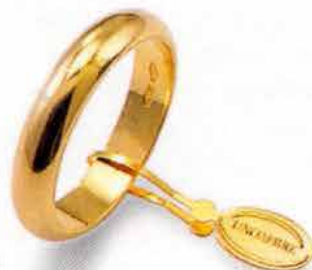
Classica oro giallo Gr. 6,0