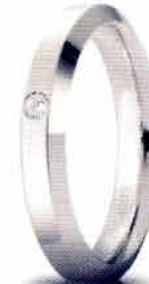
Oro bianco ct. 0.03