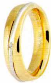
Oro giallo e bianco ct. 0.01