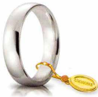
Comoda oro bianco 5 mm