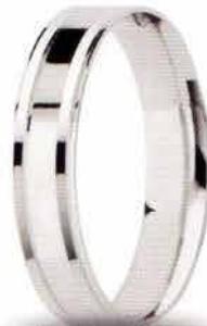
AF 305 col.04 "Fedina Comoda"