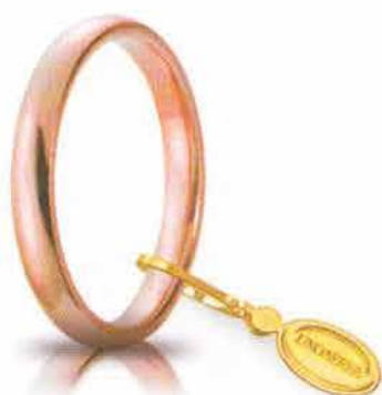
Comoda oro rosa 3 mm