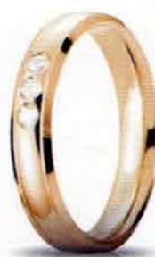
Oro giallo ct. 0.09