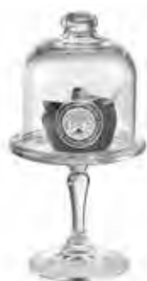
0.02833 ø 10 - h 19 cm