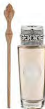
0.030744 250 ml 22,00€