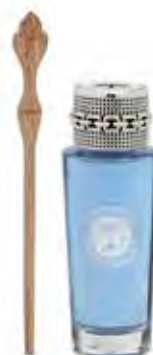
0.030754 250 ml 22,00€