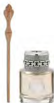
0.030741 250 ml 22,00€