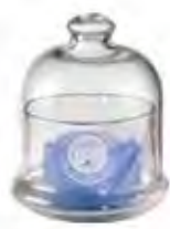
0.02819 ø 10 - h 11,5 cm 8,00€