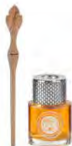
0.02659 100 ml 15,50€