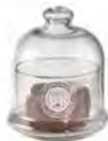
0.02823 ø 10 - h 11,5 cm 8,00€