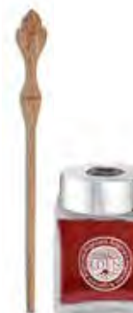
0.031203 250 ml 22,00€