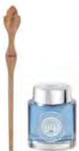
0.03115 100 ml 15,50€