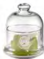
0.02822 ø 10 - h 11,5 cm 8,00€