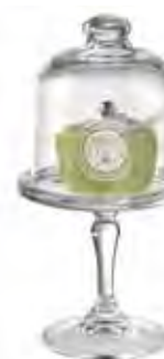
0.02831 ø 10 - h 19 cm 12,00€