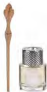
0.02647 100 ml 15,50€