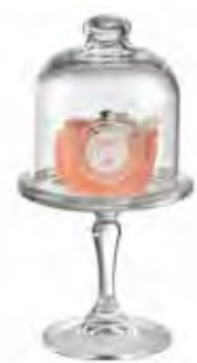
0.02830 ø 10 - h 19 cm 12,00€