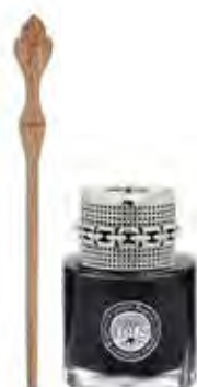
0.030801 250 ml 22,00€