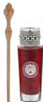
0.030814 250 ml 22,00€