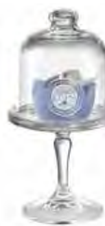
0.02828 ø 10 - h 19 cm 12,00€