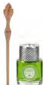
0.02663 100 ml 15,50€