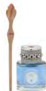
0.03075 100 ml 15,50€