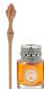
0.03077 100 ml 15,50€