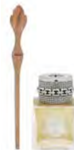
0.030762 100 ml 15,50€