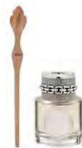
0.03074 100 ml 15,50€