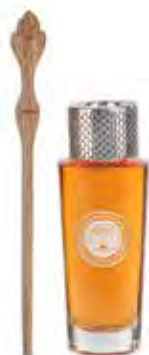
0.02658 200 ml 22,00€