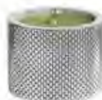
0.02665 ø 9,5 - h 7 cm Candela/Candle 24,00€