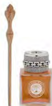
0.030793 250 ml 22,00€