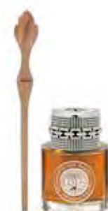
0.03079 100 ml 15,50€