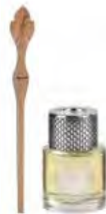
0.02655 100 ml 15,50€