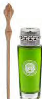
0.030784 250 ml 22,00€