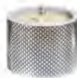
0.02657 ø 9,5 - h 7 cm Candela/Candle 24,00€