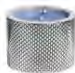
0.02653 ø 9,5 - h 7 cm Candela/Candle 24,00€