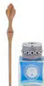
0.030752 100 ml 15,50€