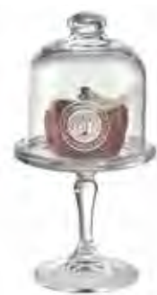
0.02832 ø 10 - h 19 cm 12,00€