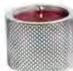
0.02677 ø 9,5 - h 7 cm Candela/Candle 24,00€