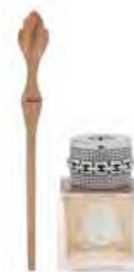
0.030742 100 ml 15,50€