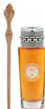
0.030774 250 ml 22,00€