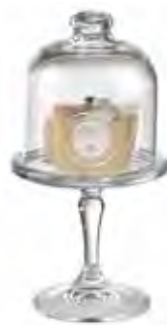
0.02829 ø 10 - h 19 cm 12,00€