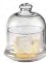
0.02820 ø 10 - h 11,5 cm 8,00€