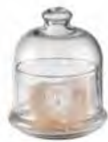
0.02818 ø 10 - h 11,5 cm 8,00€