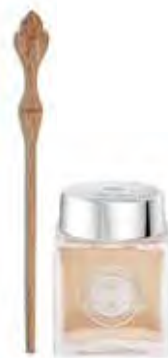
0.031143 250 ml 22,00€