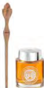
0.03117 100 ml 15,50€