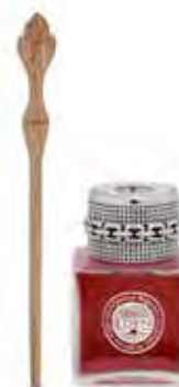
0.030813 250 ml 22,00€