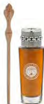
0.030794 250 ml 22,00€