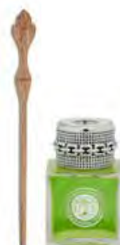
0.030783 250 ml 22,00€