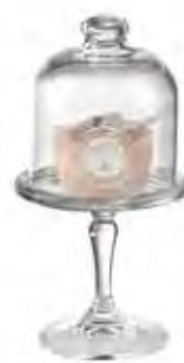
0.02827 ø 10 - h 19 cm 12,00€