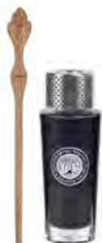
0.02670 200 ml 22,00€