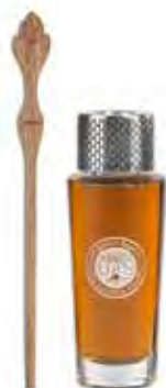
0.02666 200 ml 22,00€