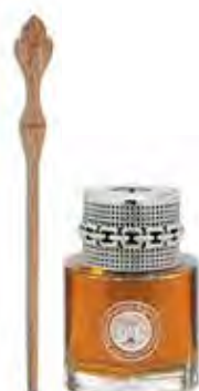
0.030791 250 ml 22,00€