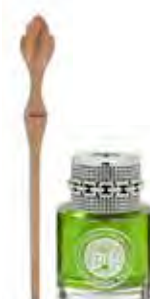
0.03078 100 ml 15,50€