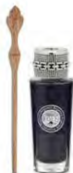
0.030804 250 ml 22,00€