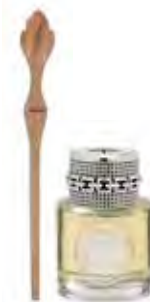
0.03076 100 ml 15,50€