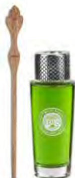
0.02662 200 ml 22,00€