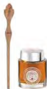
0.03119 100 ml 15,50€