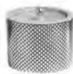
0.02649 ø 9,5 - h 7 cm Candela/Candle 24,00€