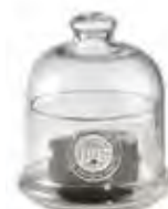
0.02824 ø 10 - h 11,5 cm