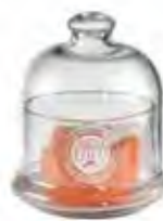
0.02821 ø 10 - h 11,5 cm 8,00€