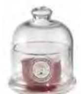
0.02825 ø 10 - h 11,5 cm