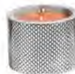
0.02661 ø 9,5 - h 7 cm Candela/Candle 24,00€