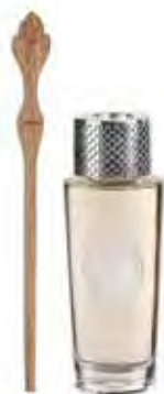
0.02646 200 ml 22,00€