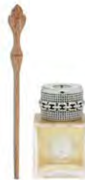
0.030763 250 ml 22,00€