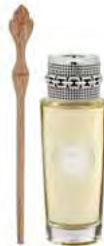
0.030764 250 ml 22,00€