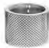
0.02673 ø 9,5 - h 7 cm Candela/Candle 24,00€