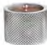
0.02669 ø 9,5 - h 7 cm Candela/Candle 24,00€