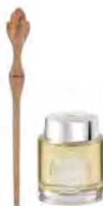
0.03116 100 ml 15,50€