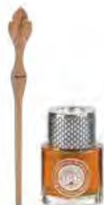
0.02667 100 ml 15,50€