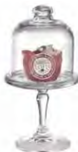
0.02834 ø 10 - h 19 cm