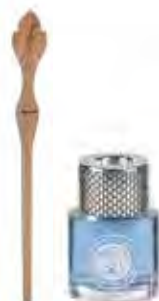
0.02651 100 ml 15,50€