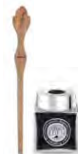
0.031202 100 ml 15,50€